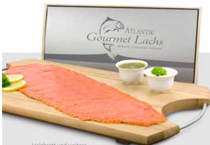
Holzbrett und weitere Accessoires nur Deko

300 g rauchzarter Atlantik Gourmet Lachs, filetiert und fertig vorgeschnitten. Mit feinem Sahne-Meerrettich und Senf-Dill Sauce, je 50 g. Verpackt in passender Holzkiste.