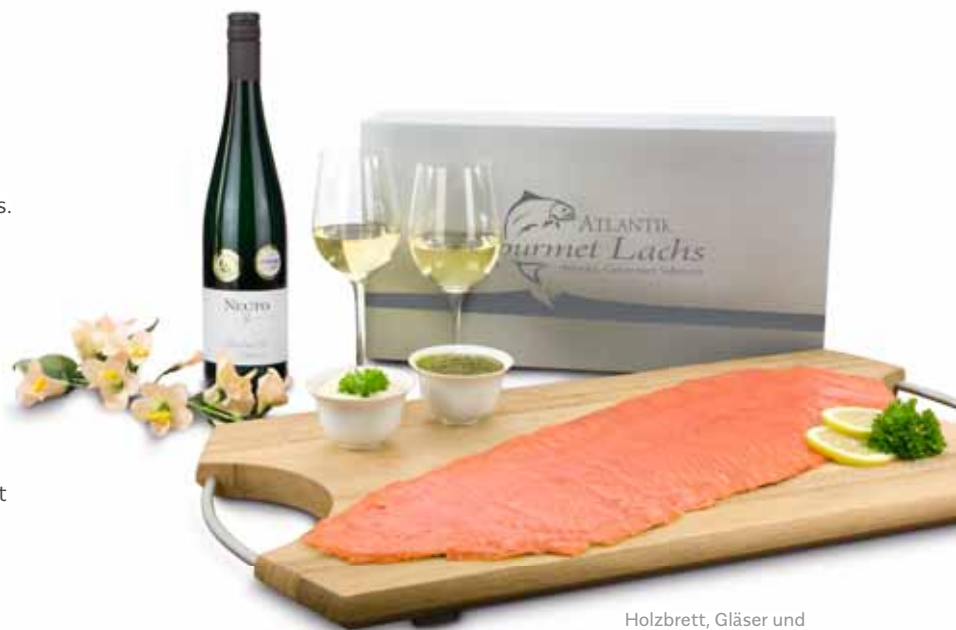
Holzbrett, Gläser und weitere Accessoires nur Deko

Unser Lachs kommt direkt aus den Fanggebieten. Frischeversiegelt und mit Paketdienst geliefert, garantieren wir für unsere Lachspräsenten bei gekühlter Lagerung eine Haltbarkeit von mindestens 21 Tagen ab Versanddatum. Bitte beachten: Wünschen Sie Lachspräsenten zu Weihnachten oder Silvester, dann senden Sie uns Ihre Bestellung bis spätestens 14 Tage vor Weihnachten.