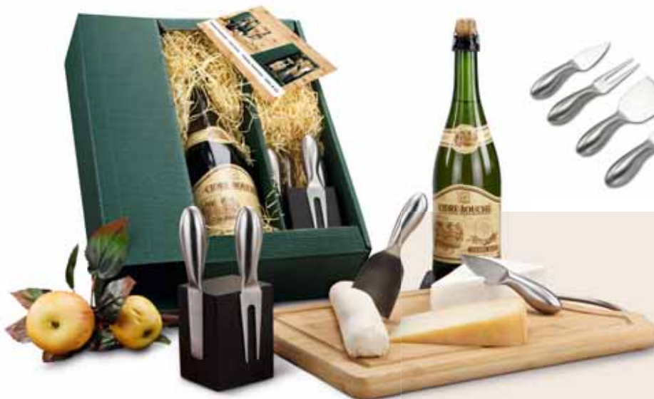
Käse und Brettchen nur Deko

Ein Präsent mit dem Sie sich abheben! Leckerer Cidre, ein Apfelschaumwein aus Frankreich (0,75 l), kombiniert mit einem praktischen, magnetischen ROMINOX® Käsemesser-Block und vier Besteckteilen für alle Käsearten. Auf einem Kärtchen finden Sie zudem interessante Informationen zum Block und zum Wein. In grünem Geschenkkarton mit Fine Cut cream.