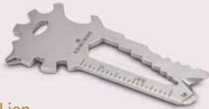
Key Tool Lion