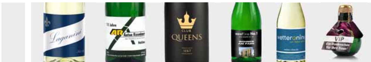
EIGENETIKETTEN, MANSCHETTEN & DIREKTDRUCK