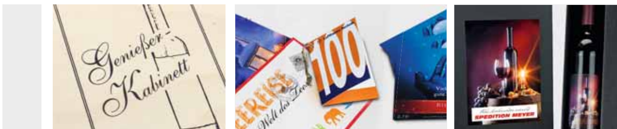
TAMPON- & SIEBDRUCK

Grundsätzlich gibt es viele verschiedene Druckmöglichkeiten. Wir wählen immer die beste Variante produktbezogen für Sie aus, um ein bestmögliches Druckergebnis zu erhalten. Schön wirken auch Aufkleber auf den Kartonagendeckeln – versehen mit Ihrem Logo und vielleicht einem Gruß an die Beschenkten. Hier stellen wir Ihnen gerne unsere Standardmotive als Basis zur Verfügung.