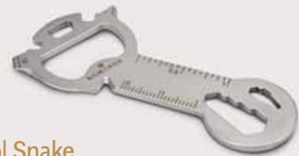
Key Tool Snake