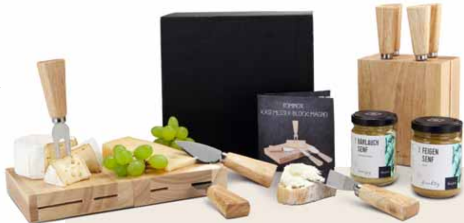
Käse nur Deko

Servieren Sie Käse geschmackvoll und praktisch zugleich. Dieses Käse-Trio enthält ein innovatives ROMINOX® Käsemesser-Set inklusive Block und je 145 g Bärlauch- und Feigensenf im Glas. Der Block dient stehend zur Aufbewahrung der 4 Käsebesteckteile und ist liegend ein flexibles Käsebrett. Ein Infolyer beschreibt die beiden Senf-Varianten sowie den Einsatz des Käsemesserblocks. Alles zusammen in einem schwarzen Karton – Fromage savoureux!